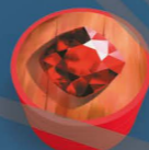
7個紅寶石標記 (紅色)