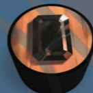
7個縞瑪瑙標記 (黑色)